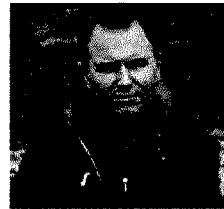
Il presidente Figisc Di Ilio

IL PRESIDENTE FIGISC Inutile abbassare il gasolio, che vende molto meno